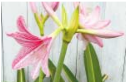
アマリリス image photo

文字広告欄 例えはこんな使い方! ●「お店の営業案内」「イベントのお知らせ」など、使い方はあなた次第です。 合同版1行12000円。 松戸全域へ情報発信! 問い合わせは編集室へ ☎04-7176-2747 まで