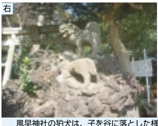
風早神社の狛犬は、子を谷に落とした様子になっている、親子獅子による獅子山