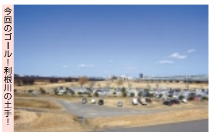
今回のゴール！利根川の土手

を注文して喉の渇きを潤 し、もりもり2枚完食後は グッタリ……。この後、 気が振り絞って天王台 駅まで歩き、どうにか帰 宅できました。 (ハイン)