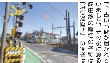
浜街道の名称がつけられた 成田線の踏切

そんな料亭やかやぶき屋 根の家(脇本陣)も見ら れます。クラックを2つ 抜けた先のコンビニ付近 のY字路で旧水戸街道は 左へ、右は成田へ続く道 この道分が我孫子宿水戸 側の出入口だったよう で、古い石碑が置かれて いました。その後、渡る 成田線の踏切の名称は 「浜街道踏切」。浜街道は 交差点を左折