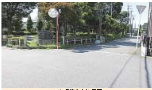
上本郷第2土地区画

多額の借り入れをしたりするなど、眠れぬ夜を過ごした理事長さんもいました。ある地区では区画整理の設計をした事務所が図面ごと夜逃げをするという珍騒動もありました。一方で、土地の売却が上手くいき資金に余裕ができ、当初の予定にはなかつ