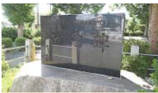
上本郷第2土地区画

資金は、小さくはなるけれども成型して価値を上げたものを返す条件で地主さんから提供してもらった土地を活用して作ります。提供してもらった土地は、一部を道路や公共施設の用地に、一部を売却して事業の資金にします。とはいえ、そのときの事情により金額に銀行巡りをすることもあったようです。