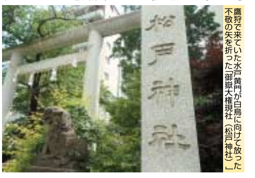
鷹狩で来ていた水戸黄門が白鳥に向けて放った不敬の矢を折った御嶽大権現社（松戸神社）

大人で四抱えほどの太さの幹の松だったので、おそらく他のものと比べて圧倒的な存在感があったでしょう。近くの釈迦堂で休息を取っていた光圀が思わず「見事な松じゃのう」と声をかけながら幹をなでたところ、それに應えるかのようについに、風もないのにその大木がゆらゆらと揺れたのだそうです。それ以来、その松の大木は「ゆるぎの松」と呼ばれるようになりました。