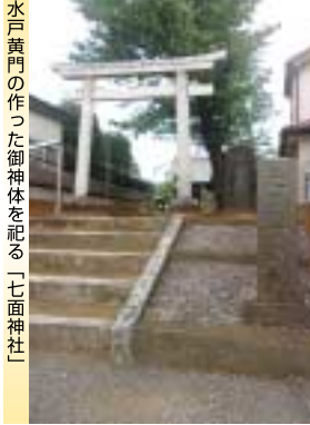
水戸黄門の作った御神体を祀る「七面神社」

御都摩の方は、小金領を一時取り戻していた武田信吉の生母です。武田姓ですが、実際のところは、清和源氏の流れをくむ武田氏の断絶を惜しんだ徳川家康が、その名跡を継がせるべく、自身の