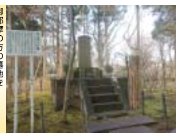
「御都摩の方の墓を「本土寺」境内に改葬

本土寺の参道脇にあった御都摩の方の墓を、本土寺境内に改葬したのもその頃です。当時は彼女の法名である「口上の松」と呼ばれた一本の古松が生えていただけだったのを光圀が見詰めたようです。