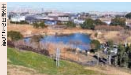
主水新田のまじも池

地名には、地形や歴史的な出来事、人々の思いがこもったものなどさまざまないわれがあります。この場所にはどんないきさつで今の地名になったのかな？昔はどのようなところだったのかな？そんなことを思いながら、街をながめてみましょう。