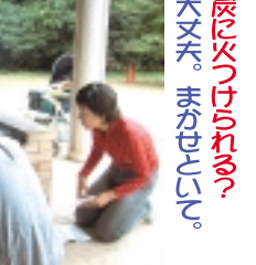
炭に火をつけられる? 大丈夫。まかせてください。