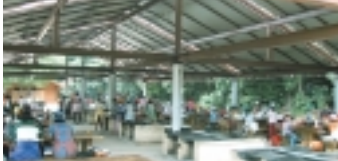
屋根付き炉 (10名様目安)

右手にはログハウス風のトイレ、正面には野外炉が20基、左手にはフリーゾーンが広がっています。夏のシーズン(七月二十日から八月三十一日)はキャンプが楽しめるテントサイトが20区画右奥にあります。