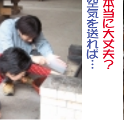
本気で大丈夫? 空気を送れば!