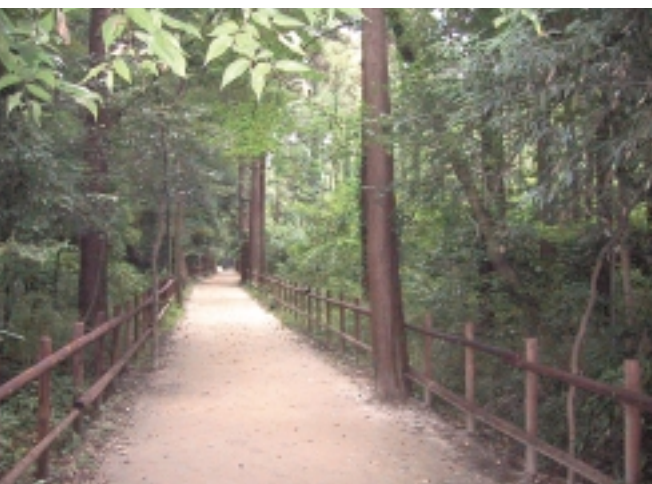
駐車場から広場へ続く道。「ほんとにここは松戸?」

暑かった夏も終わり、野外活動にぴったりの季節がやってきましたね。食欲の秋でもありますが、家族や仲間と外でワイワイ、ガヤガヤと食事をしてみませんか。題して「外メシ」。そのなかでも、「こんな近くでできるんだ」と驚きのパーベキューです。