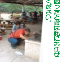
困ったときは私にお任せください。