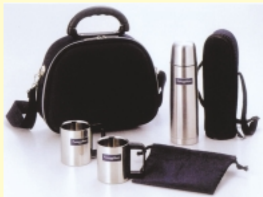
A賞/フローレンスケリーSTボトル&マグ2pcsセット