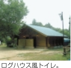
ログハウス風トイレ。

私たちが伺った日は、朝から雨が降ったりやんだりの1日でしたが、屋根付きの炉は全く雨の影響はなく快適でした。アウトドアセンターで購入した物やレンタル用品は各炉の所まで運んでくれます。わからない事は何でもスタッフに聞いてください。とっても親切に教えてくれます。私たちも炭に火を点ける事ができずに、スタッフの方にお願いしました。するとあっという間に炭に火が点いたのです。「終わったら、声をかけてください」とスタッフの方はアウトドアセンターに戻っていきました。あとは肉や野菜を焼いて食べるだけ。終わってスタップの方に声をかけるとなんと後片付けまでもしてくれます。初心者や道具を持ってない人でも大丈夫です。それ以外「外メシ」の良いところは、子供たちが少しくらい大