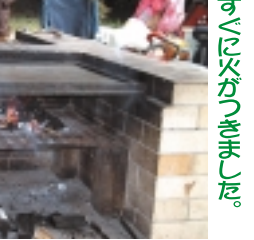
すべし火がつきました。