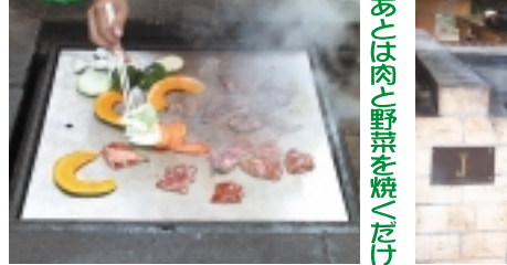
あとは肉と野菜を焼くだけ。