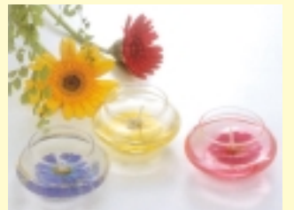
C賞/フラワーポットキャンドル