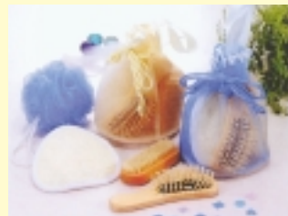
B賞/メッシュ巾着入バス入浴セット