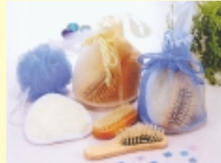
B賞/メッシュ巾着入バス入浴セット