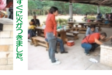
困ったときは私にお任せください。