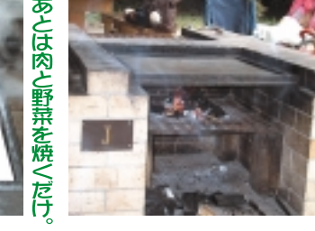
すでに火がつきました。