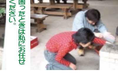
本気で大丈夫? 空気を送れば!