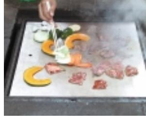
あとは肉と野菜を焼くだけ。