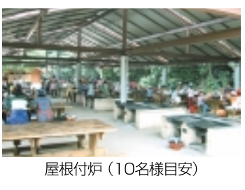
屋根付炉 (10名様目安)

右手にはログハウス風のトイレ、正面には野外炉が20基、左手にはフリーゾーンが広がっています。夏のシーズン（七月二十日から八月三十一日）はキャンプが楽しめるテントサイトが20区画右奥にあります。