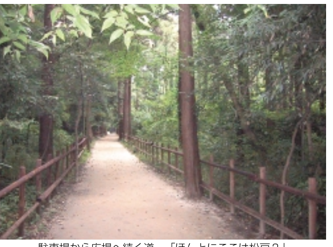
駐車場から広場へ続く道。「ほんとにここは松戸?」

暑かった夏も終わり、野外活動にびったりの季節がやってきましたね。食欲の秋でもありますから、家族や仲間と外でワイワイ、ガヤガヤと食事をしてみませんか。題して「外メシ」。その中でも、「こんな近くでこんなだ」と驚きのパーベキューです。松戸にお住まいの方なら21世紀の森とひろはよくご存じですね。今回はそのお隣にあるパーベキュー施設をご紹介します。名前は「木もれ陽の森」です。