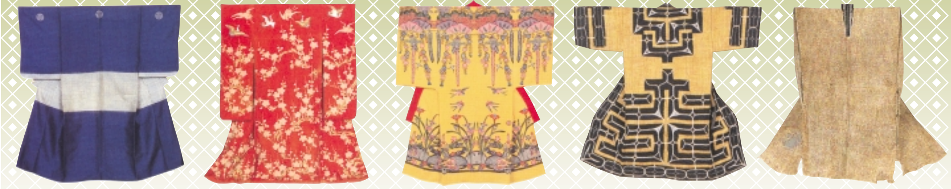
江戸時代 葵紋入りしじら熨斗目 | 江戸時代 飛騨梅花紋様紅花振袖 | 沖縄 紅型(ピンガタ) 黄色は王家のみに着用が許された色 | アツシ織 オヒョウの木の皮を剥いて作ったアイヌの民族衣装 | アンギン 縄文時代の遺物といわれている