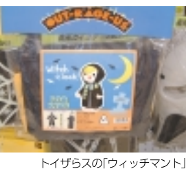
トイザラスの「ウィッチマント」

さらにハロウィン気分を十分に味わいたい方は、グッズ等を集めてみてはいかがでしょう? 伊勢丹新館6Fの趣味雑貨「フラワーアレンジメント」を紹介し、本物そっくりのかぼちゃの置物やかぼちゃの形をした鉢の中に、フラワーアレンジした、かわいいキャラクター入りの手作り品を販売しています。こちらでは、「シルク