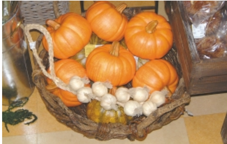
フラワーアレンジメントの本物そっくりな「かぼちゃの置物」