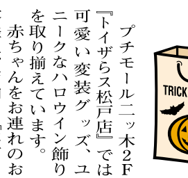
トイザラスの「パンキンマン」

プチモール二ツ木2F「トイザラス松戸店」では、可愛い仮装グッズ、ユニークなハロウィン飾りを取り揃えています。赤ちゃんをお連れのお客様は、店内に「ベビー休憩室」もありますのでご利用下さい。(おむつ替え・授乳室あり)クリスマス商品も多数取り揃えています。