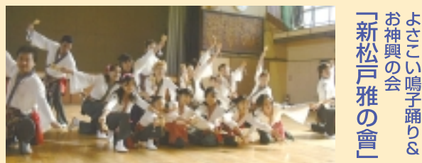
よさこい鳴子踊りとお神輿の会「新松戸雅の會」

今回は、日本各地でひそかに盛り上がりつつあるよさこい鳴子踊りとお神輿の会「新松戸雅の會」を紹介したいと思います。松戸市新松戸で99年2月に結成されました。メンバーもただいま50名ほどいます。新松戸南小学校での学校祭で発表するというのが聞いて取材にお伺いしました。どんな踊りなのかしら？と思いましたが、以前テレビで見た、金八先生で生徒たちが踊っていたソーラン節を編曲した踊りといえは親しみがあるかもしれません。そのままでした。その他オリジナルの曲も見せていただき、メンバーの皆さんもたのしそうにダンスしていました。