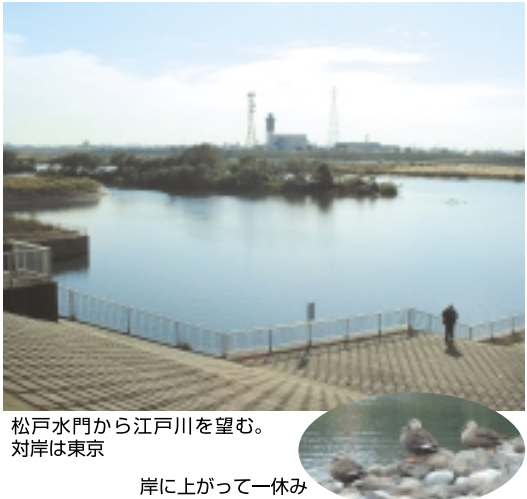
松戸水門から江戸川を望む。対岸は東京

今回は坂川放水路が江戸川へ通じている「松戸水門」から「矢切」まで、約10キロを自転車で南下しました。途中にいろいろな公園やスポーツグラウンドもあり、設備も整っています。お手軽に散策してみませんか？川沿いは、サイクリング