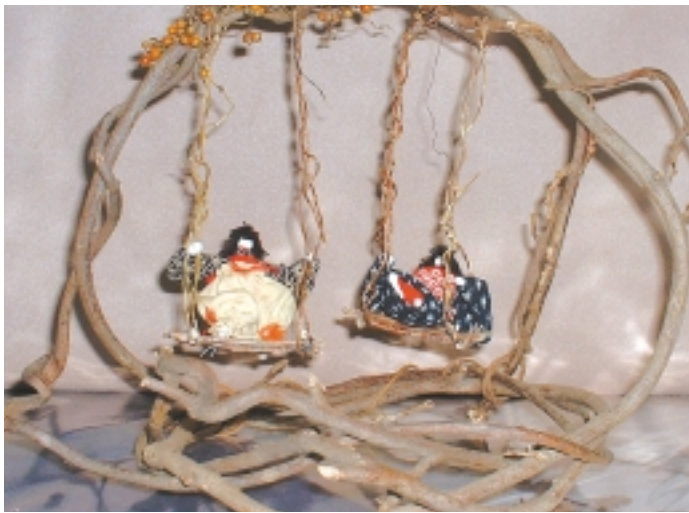
原点となったお雛様