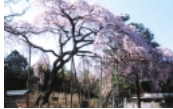
東漸寺のしだれ桜

●ソメイヨシノについて 天気予報での桜開花予想だと、桜前線などといわれ、皆さんもご存知のソメイヨシノという品種です。日本にある野生の桜の品種は全部で9種類しかないそうで、これらから数えきれない程の栽培品種が作られたそうです。栽培品種の多さは日本がダントツです。ソメイヨシノは、江戸末期・明治初期にあらわれた品種で、東京(江戸)駒込の染井にあつた植木屋から、桜の名所・奈良県吉野山の名前をとって「吉野桜」として売り出されました。しかし、吉野山の桜は野