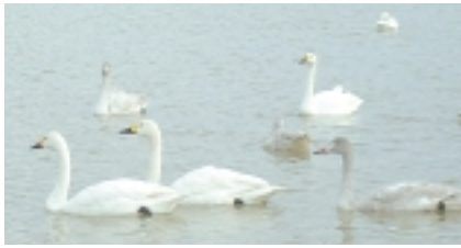
今はどのあたりを飛んでいるのかな～

◎本榎村の白鳥 この冬、大変な人気を呼んだ「本榎村の白鳥」は、各メディアにも多く取り上げられましたので、読者の方にも、本榎村を訪れた方がいらつしやる