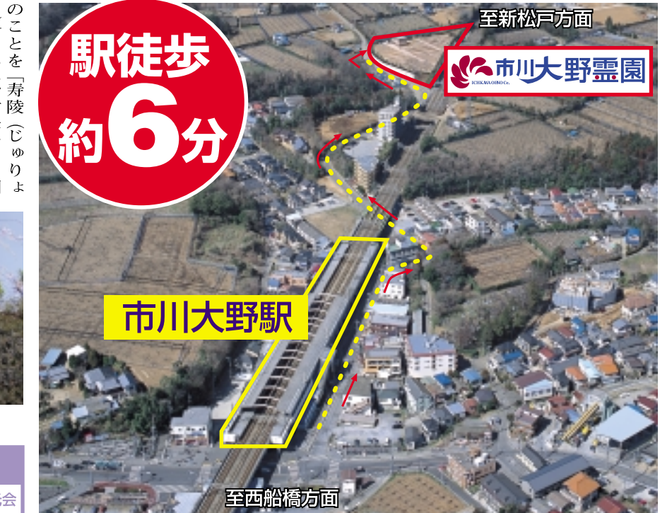
市川大野霊園概要 ■所在地/市川市大野町3-1488 ■総面積/6,990.84㎡ ■区画数/1,254区画 ■経営主体/宗教法人 礼林寺 ■許可番号/市川市第2003-1号

のことも「寿陵(じゅりょう)という、古来から中国では生前にお墓を建てることは、長寿を授かる縁起のよい行いとされ、日本にもその習慣が伝わってきたそうです。建墓の6、7割りが寿陵(生前墓)と聞き、自分らしさを求める方の多さに感心しました。墓石の形や種類も現在では多岐にわたり、昔ながらの代々のものから家族のものへと様変わりしているようです。『寿陵墓を持つ』ということは「安心感を持つ」ということです。そして万が一の時、残された家族の「心のよりどころ」になるのです。」と和泉家石材店・富田氏のお話はとても説得力がありました。