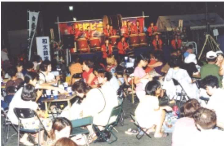
去年の賑わい

夏はビールだ! 矢切の街だ!を合い言葉に、今年も「第9回、矢切ビールまつり」が、8月6日(水)、7日(木)の2日間(雨天決行)開催されます。場所は、北総開発鉄道「矢切駅」の駅前ロータリーです。 ちなみに去年の「矢切ビールまつり」では、2日間で約4000人近い人出で、飲まれたビールは5000リットルを超えたそうです。