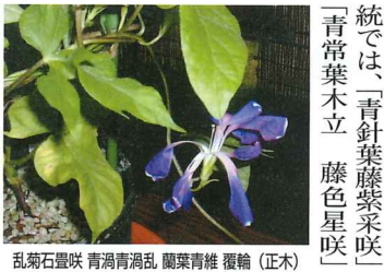
乱菊石畳咲 青高青濁乱 藤葉青維 覆輪 (正木)