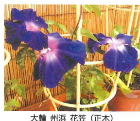
大輪 州浜花笠 (正木)

花の名前も大変凝ったものが多く、ほんの少しを紹介してみますと、正木系統で、「黄縮細輪葉紅覆輪車紋切咲」「青糸柳葉藤紫咲」「青斑入鍬形葉垂枝」「青堺渦打込蜻蛉柳葉」「青撫子咲」「青尾長掬水爪龍葉」「淡紫地車紋風鈴獅子咲」等が、出物系統では、「青針葉藤紫咲」「青常葉木立」「藤色星咲」