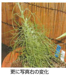
更に写真右の変化