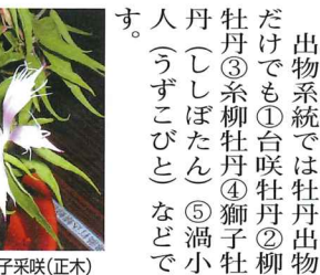
青水晶 斑入 林風 孔雀葉 石化白切咲 (正木)