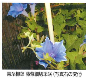
青糸柳葉 藤紫細切咲 (写真右の変化)