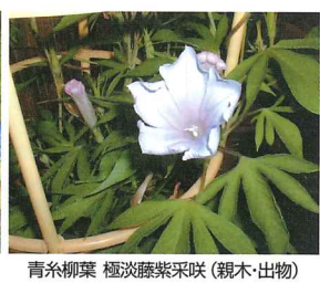
青糸柳葉 極淡藤紫咲 (親木・出物)