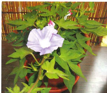
青常葉 木立 藤色星咲 (出物)

花の変化は正木系統で、①州浜大輪、②石畳咲、③だたみざき、④乱菊、⑤福福南天、⑥うもりなんてん、⑦渦(うず)、⑧桔梗咲(ききょうざき)、⑨立田(たつた)、⑩車咲(くる)