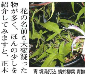
青堺渦打込 蜻蛉柳葉 青撫子咲 (正木)