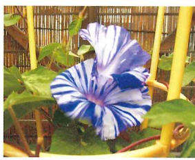
大輪 州浜紋 (正木系統)

今回は8月21日、29日まで、金ケ作の育苗圃で開催された「江戸時代から伝わる、珍しい朝顔の鑑賞会」を訪ねて学んできました。なお、朝顔は9月いっぱい咲きますので、鑑賞会終了後も見ることが出来ます。