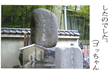
鼠小僧次郎吉の墓

いわれています。 上杉家の追っ手を避けるために、義士たちは、回向院に開門を願いましたが、開門はされませんでした。回向院は、勸進相撲の元祖でもあり、大相撲とはたいへんゆかりのある無宗派のお寺です。の鼠小僧次郎吉の戒名つきのお墓がありますよ。