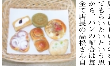
おすすめ! バナナパン

「コーデ・アル」手作りのパンの店。北小金駅の北口商店街の通りをすぐ左へ入ると緑色の看板が目印の小さなパン屋さんの発見。身が行きます。配合の段階で卵や牛乳を使わずに作ることが出来るので、アレルギーの方はもちろん塩分や糖分などの食制限のある方はぜひ事前に相談してみたいです。添加物を一切使っていないので置いておくのとパンの水がどどんと飛んでいってしまう。そのため粗熱がとれたパンから一つづつ丁寧にビニール袋に入れていきます。この一手間をかけることで焼き立ての風味をいつでも味わうことができるのです。 これから暑い季節に筆者のイチ押しはバナナパン(137円)です。バナナが丸ごと一本カスタードクリームと一緒に包み込んであります。そのまま食べても美味しいですが、冷蔵庫で少し冷やすと喉ごしが良くなります。