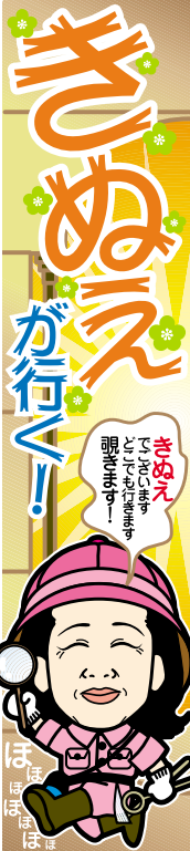
きぬえ 調子もよき 調子もよき 調子もよき