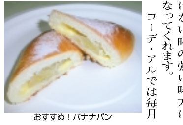
おすすめ! バナナパン

住所 松戸市殿平質 195-11 047-348-6835 営業時間 10:00~20:00 定休日/月曜日 駐車場 2台