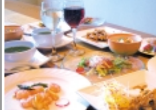
写真「レディースコース」(2100円)は2名様からの注文となっております。活鮮魚のカルパッチョ、翡翠、ひすいのコンソメスープ、海老の紅麹炒め揚げ物、添え、豚肉と若鶏と菜々野菜炒め、カジキマゴロと豆鼓炒め、春のまぜと飯、日替わりデザート付き。どれも素材の旨味が十分にでており、鮮魚の絶妙な柔らかさと味が舌に

今回は中華・和食の創作料理店「kuishin-坊」を紹介いたします。さかな屋さんが経営するこちらのお店では常に新鮮で良質な素材を使ったメニューをリーズナブルな価格で提供しています。