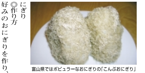
富山県ではポピュラーなおにぎりの「こんぶおにぎり」

【タラ汁】 富山と新潟の県境にある宮崎海岸は別名「ヒスイ海岸」と呼ばれています。名前の由来はヒスイの原石が見つけられるからです。また、宮崎海岸 ◎材料 タラ、ねぎ、味噌 ◎作り方 ①鍋に昆布を敷いて水を入れて火にかける。 ②お湯が沸騰してきたらタラを入れる。 ③アクをとりながら煮込む。 ④全体に火が通ったら味噌で味を整える。 ⑤ねぎを散らして出来上がり。 ◎プラス タラのアラや白子も一緒に入れるとより美味しくなります。また昆布は取り出さず一緒に食べてもよいですよ。