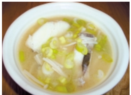
富山の名物「タラ汁」

【タラ汁】 富山と新潟の県境にある宮崎海岸は別名「ヒスイ海岸」と呼ばれています。名前の由来はヒスイの原石が見つけられるからです。また、宮崎海岸 ◎材料 タラ、ねぎ、味噌 ◎作り方 ①鍋に昆布を敷いて水を入れて火にかける。 ②お湯が沸騰してきたらタラを入れる。 ③アクをとりながら煮込む。 ④全体に火が通ったら味噌で味を整える。 ⑤ねぎを散らして出来上がり。 ◎プラス タラのアラや白子も一緒に入れるとより美味しくなります。また昆布は取り出さず一緒に食べてもよいですよ。