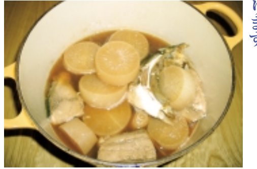
これからの時季におすすめる「ぶり大根」

【ぶり大根】 晩秋から初冬にかけておこる暴風雨や雷といった大荒れの日を「ぶりおこし」と言います。この頃からぶりの水揚げが本格化し、特に富山湾西端の氷見で獲れるぶりは有名です。 ◎材料 ぶりアラ、大根、しょうが、調味料(酒、みりん、砂糖、しょうゆ) ◎作り方 ①大根は皮をむき、大きめに切ります。しょうがは薄切りにし、すりおろし、酒、みりん、砂糖、しょうゆを加えておこしを煮込みます。