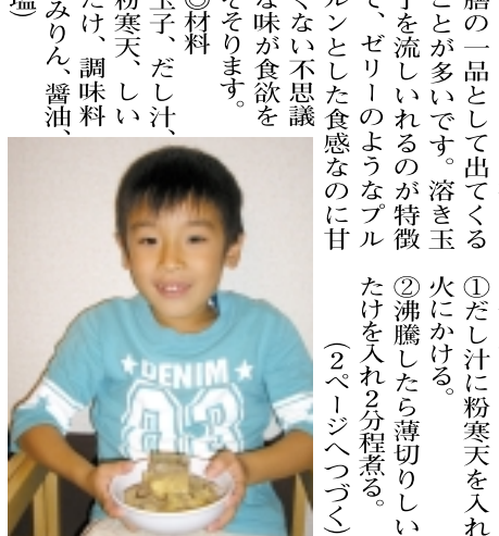
べっこうのような食感がたまらない「べっこう」

【べっこう】 べっこうは祝儀不祝儀を問わず出されることが多いです。溶き玉子を流し入れるのが特徴で、ゼリーのようなプルプルとした食感なのに甘くない不思議な味が食欲をそそぎます。 ◎材料 玉子、だし汁、粉寒天、しいたけ、調味料(みりん、醤油、塩) ◎作り方 ①だし汁に粉寒天を入れ、火にかける。 ②沸騰したら薄切りにしたしいたけ、調味料(みりん、醤油、塩)を加えて煮込みます。