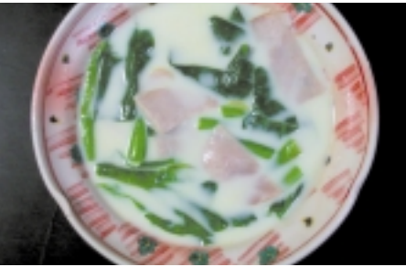
ほうれん草とハムのミルクスープ

*忙しい朝にはあったか スープで心も身体もポツカボカ「白菜とベーコンのスープ」 ◎材料(2人前) 白菜1/8個、ベーコン4枚、ローリエ1枚、固形スープの素1個、塩小さじ1/3、コショウ少々 ①白菜はたてに3等分し、幅4cmにカット。ベーコンは幅2cmほどに。 ②鍋に水600cc、白菜の芯、ローリエ、ベーコンと固形スープの素をくずして入れる。5分ほど煮る。 ③白菜の葉を加え塩、コショウで味付けする。