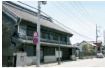
下館界隈の蔵の街並み

（1ページからのつづき）文化勲章受章者の板谷波山先生の功績をたたえた記念館です。館内には先生の作品、生家、そして数々の名品を生み出した三方焚口倒台式窯をはじめ貴重な道具が展示されています（入館料200円 休館日/月曜日。なお、当館にも「しもだて見どころ案内図」が置いてあります。まだ入手していない方は、「UKIUKIで見たい」といつていただいでください。