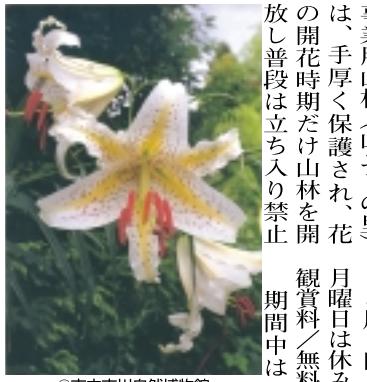
市立市川自然博物館の「大町自然観察園」の閉門時間を午後8時30分まで延長します。入園は午後8時まで。土日は混み合います。

開園20周年を迎えた「市川市動物園」。北線「大町駅」側から園入口までの道路の歩道が、以前はたいへん狭く、徒歩・自転車ともに怖い思いをしました。今では整備され、歩道も広く自転車置き場も設置されて安心です。今回は「市川市動物園」の夏の風物詩、「山ユリ観賞会」と、「ホタル観賞会」のご案内です。