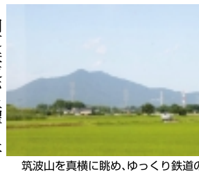
筑波山を真横に眺め、ゆっくり鉄道の旅

関東鉄道が土曜と休日限定発行している「常総線一日フリーきっぷ」は、取手～下館間が一日乗り放題で、ナント1500円です。乗車券は関東鉄道・常総線「取手駅」の窓口でご使用当日お求めください。また「UKIUKI Iで見た」といって駅員に請求すれば「沿線ガイド」がいただけます。ちなみにこの路線の通常価格が片道1460円、「松戸駅」から常磐線で友部経由下館は片道1890円となります。迫力あるSLを見るには、取手発8時40分が便利でしょう(下館9時59分着。では一日フリーきっぷを買って「出発進行!」