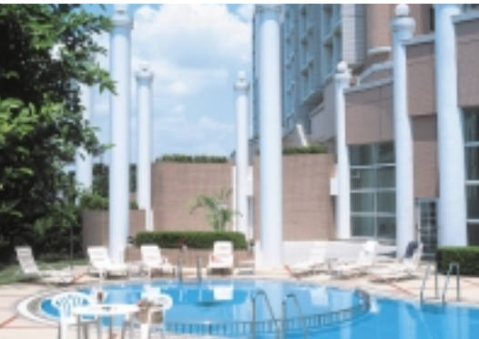
近くのホテルでゆっくりリゾート気分! (東京ベイホテル東急)

プール営業時間/10時~19時 ランチ/11時30分~14時30分(土日祝11時30分~15時) 料金/大人5,000円、小学生3,000円、未就学児2,500円(税・サービス料込) ★日本料理「万葉」のランチセットとプール利用がセットになった「舞浜小町」にもお子様料金がありませんので詳しくはお問い合わせ下さい。 中国料理「孔雀」の飲食バイキングもおすすめです。取材料が豊富で、舞浜小町にもお子様料金がありませんので詳しくはお問い合わせ下さい。 中国料理「孔雀」の飲食バイキングもおすすめです。取材料が豊富で、舞浜小町にもお子様料金がありませんので詳しくはお問い合わせ下さい。