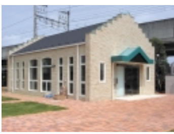
休憩できるスペースがあると、とても便利です

す。管理棟には休憩できるスペースがあるので、家族の団欒の場所として利用されてみてはいかがでしょうか。挽きたてのコーヒーマービスもありますよ。