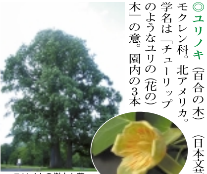
ユリノキの樹木と花 ユリノキは「チューリップ」の意。園内の3本

「新宿門」のとなりにあるインフォメーションセンター(無料)に寄って情報を仕入れましょう(喫茶を兼ねた休憩所もあり)。ここで「新宿御苑」案内図をいただき、第一目的の「ユリノキ」を中心に主な樹木を訪ねてみましょう。 ●「巨樹の紹介」 「新宿御苑」は、環境省の管轄にあります。まず園内の主な巨樹を紹介しましょう。 ●「ユリノキ」(百合の木) モクレン科 北アメリカ。学名は「チューリップ」のようなユリの(花の)木」の意。園内の3本