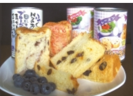
もともと保存食として考案された缶詰。現在ではユニークな缶詰も登場。1923年の関東大震災では非常食として利用されたという歴史があります。

★アキバ名物 ラーメン缶・おでん缶 秋葉原電気街では、電気店や雑貨店の店頭で並ぶラーメン缶やおでん缶が目立ちます。一見ミスマッチのこんな光景も、何でもありの秋葉原ならではの楽しいサブライズ。ラーメン缶やおでん缶は自動販売機でも販売され