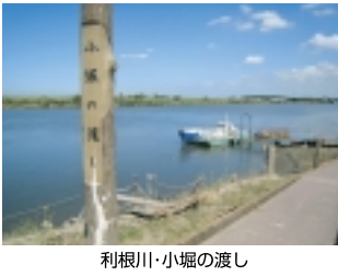
利根川・小堀の渡し

「おもしろい、新しいアート」を散策してみましよう。文化芸術課 ☎0297-74-2141 (内) 2061