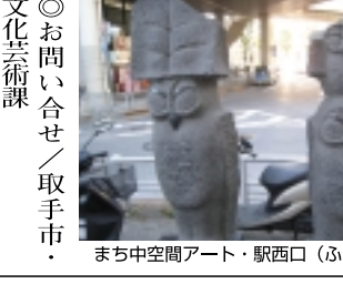
まち中空間アート・駅西口 (ふくろう家族)

「旧水戸街道・取手宿」の街並みと新しいアートの街並みの散策、いかがだったでしょうか。ここ取手宿界隈には、この他にも史跡や遺産があり、また東京藝術大学の交流、市民アートギャラリーなど盛りだくさんです。これらの詳しい情報は、取手市役所ホームページより「文化・歴史・観光」へアクセスし閲覧することができます。