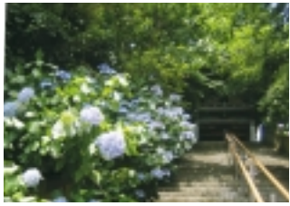
あじさいが美しい長禅寺の長い階段と山門 (6月27日撮影)

静かな境内には本堂、八十八番所お堂、小川芋銭の筆による小林一茶の句碑などがあり、池をめぐらす庭園では、梅、桜、紫陽花、紅葉など、四季折々の風情が楽しめます。