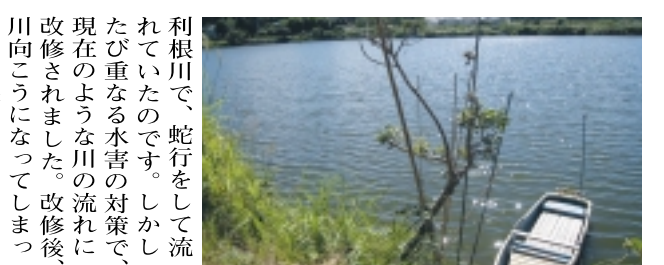
神秘的な古利根沼 (かつて利根川の一部)

「1ページからのつづき」 利根川は「阪東太郎の異名をもち、「日本三大暴れ川」といわれたその川も、今は悠々と大きく流れています。私たちが日頃見慣れている江戸川の河川敷とは異なつた、情緒豊かな芝生の草原でお弁当でも広げるには格好の場所かも知れませんよ。ところで、この利根川に渡し舟があるのをご存じですか？取手側から川向こうの我孫子岸まで、100円で乗れる「小堀（おほり）の渡し」が運行しています。ちよつと行ってみましよう。