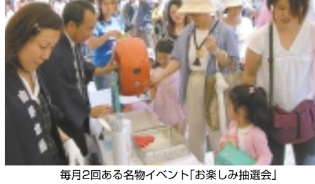
毎月2回ある名物イベント「お楽しみ抽選会」