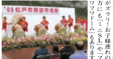
06松戸市南部市場新

【市場祭】 年に1度の大会イベント「松戸南部市場祭」は、松戸市民の方に日頃の感謝の気持ちを込めて開催されています。11月11日(日)、9時~14時。松戸市の方に楽しんで頂く! 1日居ても飽きない! をモットーに、毎年大人気で、昨年も家族連れの方が3万人以上も来場されたのだとか。会場には市場ならではの模擬店もあり、お得な品物がズラリ! お子様連れの方にも「ミニSL」や「フワフワドーム」もあります。