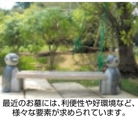
最近のお墓には、利便性や好環境など、様々な要素が求められています。