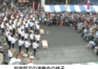
市場祭での演奏会の様子

【市場祭】 年に1度の大会イベント「松戸南部市場祭」は、松戸市民の方に日頃の感謝の気持ちを込めて開催されています。11月11日(日)、9時~14時。松戸市の方に楽しんで頂く! 1日居ても飽きない! をモットーに、毎年大人気で、昨年も家族連れの方が3万人以上も来場されたのだとか。会場には市場ならではの模擬店もあり、お得な品物がズラリ! お子様連れの方にも「ミニSL」や「フワフワドーム」もあります。