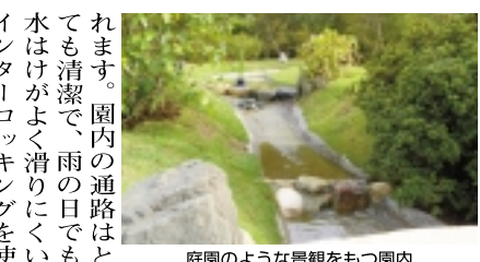
庭園のような景観をもつ園内