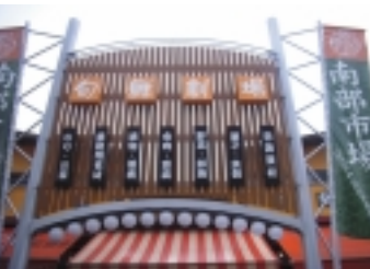
市場祭での演奏会の様子

【旬鮮劇場】 今年、6月23日にリニューアルした「松戸南部市場」にはもう足を運ばれなかったか。敷地は1万6000坪あり、広々としていて活気が溢れています。場内には「水産」「青果」「花卉」「関連食品」の4部門があり、松戸市のみならず近隣地区への供給基地として利用されています。