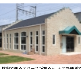
休憩できるスペースがあると、とても便利です

また、近所のお墓が遠く、自宅の近くにお墓を移す「引越す」という「改葬」も、「和泉家石材店」ではいろいろな場合に合わせた的確なアドバイスや必要書類の用意、手助けをしてくれます。「いつでも会いに行ける」ということはお墓参りに安心しますね。現在「改葬キャンペーン」をやっているのをご存知ですか? 利用したい方は、ぜひお早めにご予約ください。