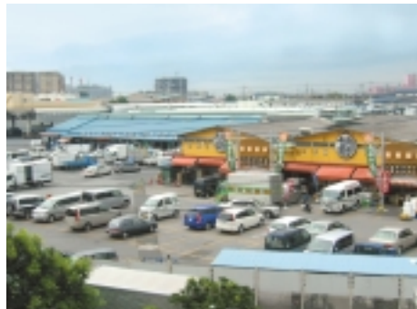
生まれ変わった「旬鮮劇場」こと「松戸南部市場」

「市場」といって「行きづらい場所」とお思いの方もいるのではないのでしょうか。筆者自身そういう先入観があったので実際に足を運んでみました。