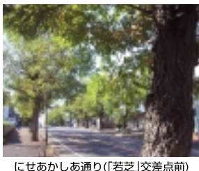
にせあかしあ通り(「若芝」交差点前)

【たいわんふう通り】UKIUKI243号の「街路樹：新松戸編」で紹介、記者は大変な思い違いを致しまして、読者の皆さまからの問い合わせをいただきました(申しわけございませんでした。今度は間違いなく「たいわんふう通り」の紹介です。水戸街道(国道6号線)を柏に向かっ、JR「北小金駅入口」の信号を過ぎて、次の「小金原団地入口」の信号を右折した