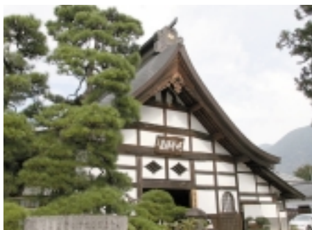
【恵林寺(えりんじ)】 武田信玄公の菩提寺。四脚門(重文)、そして三門(県文化財)、本堂と続