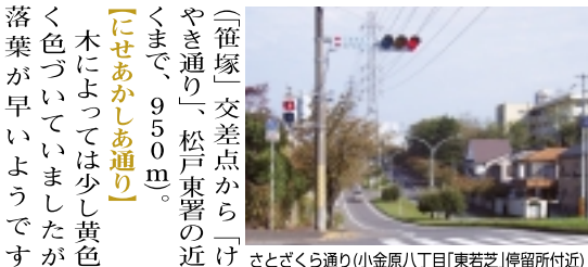
さとざくら通り(小金原八丁目(東若芝)停留所付近)