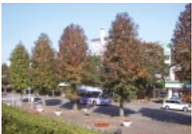
あめりかふう通り(栗ヶ沢公園前)

【あめりかふう通り】アメリカカフウは所々色づき始めました。1本の木でも葉は何色にも変化に富んだ色をしています。「栗ヶ沢テニスコート」駐車場より見下ろすと、きれいです。また「栗ヶ沢公園」内には、カッタ、ケヤキ、イチヨウ、ユーカリなどの巨木があります。