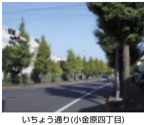
いちよう通り(小金原四丁目)

松戸の「街路樹」第3回は、すっかり秋パージョンの小金原を訪ねました。小金原地区の歴史は以外と新しく、昭和44年に小金原団地の入居が開始。51年に小金原支所が開所しました。街は歩道、車道ともにきちんと整備されています。アップダウンの多い道路ですから、少時間のウォーキングでもいい運動になります。公園、ケイ屋さん、レストラン、ショッピングなども一杯の楽しい小金原の街を歩いてみましょう。