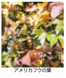
アメリカカフウの葉

【あめりかふう通り】アメリカカフウは所々色づき始めました。1本の木でも葉は何色にも変化に富んだ色をしています。「栗ヶ沢テニスコート」駐車場より見下ろすと、きれいです。また「栗ヶ沢公園」内には、カッタ、ケヤキ、イチヨウ、ユーカリなどの巨木があります。