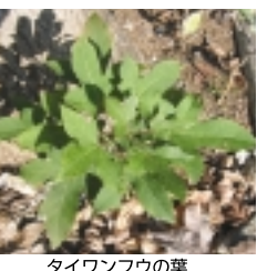
タイワンフウの葉

ところから、「いちよう通り」までです。アメリカカフウより紅葉は遅いようでしたが木々は青々としていました(全長65mと今回紹介した通りでは一番短い)。