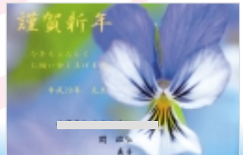
小金/関政弘さん 色鮮やかな作品ですね。これから始まる新年が楽しみになりそうです。