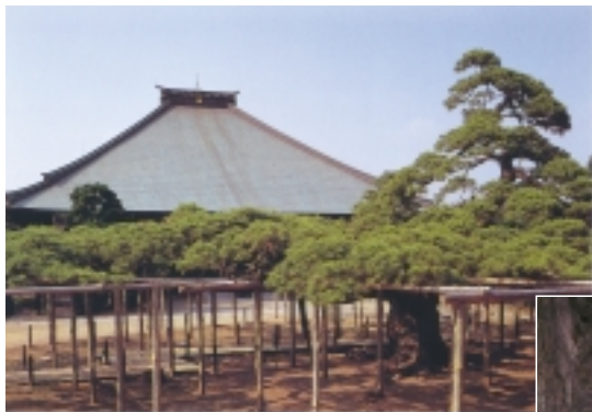
影向の松