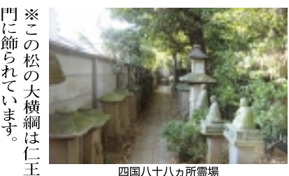
四国八十八カ所霊場