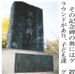
その記念碑の奥にはグラウンドがあり、子ども達

桜並木が美しい、六美のグリーンベルト(さくら通り)のすぐ脇にある「六美中央公園」。広々としたグラウンドがあるこちら公園に入るとまず目に飛び込んできたのは、大人も見上げる程大きな石碑でした。こちらは「松戸市・六美高柳土地区画整理組合」の記念碑です。当地域の区画整理事業を遂行した事業関係者に対し、その苦勞の成果と感謝を永く記念するために昭和60年に建立されたものです。