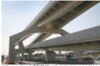
3本に分岐する「日暮里・舎人ライナー」の軌道

元気のある方はもう少しがんばりましょう。次の「舎人駅」を過ぎると、まもなく終着「見沼代親水公園駅」に着きます。折角ここまで来たので、この専用軌道の最先端部分を記念に撮影してみました。