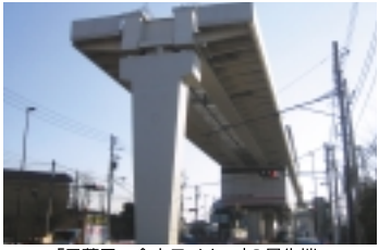
「日暮里・舎人ライナー」の最先端

などもきれいに咲くとのことでした。 ◎お問い合わせ/舎人公園管理事務所 ☎03-38857-2308 またはホームページ「舎人公園」等でアクセスしてみてください。 さて公園を出たところで、今まで整然としてきた専用軌道がここで3本に分岐されて、その一路が下に降りてきて、地中へ潜ってしまっていました。実はこの「舎人公園」敷地の所に車両基地があり、その引き込み線だったのです。