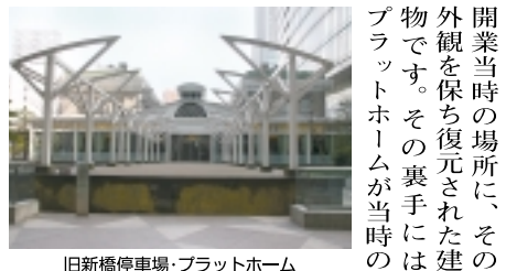
旧新橋停車場、プラットフォーム