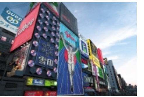
大阪-西日本屈指の歓楽街、「ミナミ」の一角である道頓堀

「お好み焼き」は、明治時代屋台や駄菓子屋の店先で売られていた「洋食焼き」がルーツと言われている。小麦粉を水で溶いた生地を鉄板で薄く焼き、その上に刻みキャベツや紅しょうがを載せてソースで味付けしただけのシンプルなお菓子です。小さく切った古新聞に載せたものが1銭で買えたことから1銭洋食とも呼ばれていました。その後子供達のお菓子から大人達に受け入れられる過程で、大人の嗜好