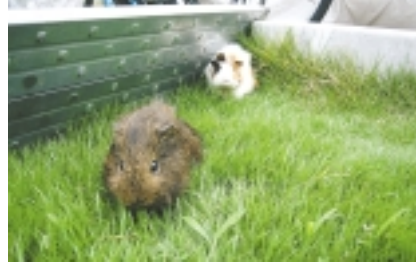
ペットは家族の一員。飼うと決めたらペットの一生に責任を持ちましょう

「エキゾチックアニマル」とは日本では「エキゾチックアニマル」の人気選手である小鳥やハムスター、フェレット、ウサギなど、彼らの鳴き声を発する事もなく、カゴの中で飼育できるなど、比較的飼育しやすい動物として家族に迎えようとする方が増えているようです。ただし動物を飼育する際には、まずその生態や特徴を理解する事が大切