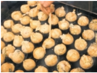
大阪の料理と言えば、まずはこれ!

余談ですが、大阪道頓堀で60年創業してきた「くだおれ」が来月7月8日をもって閉店することです。1人でご存知だと思います。大阪名物にもなっている