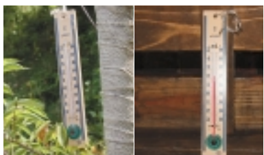
トンネルの内部と外では、温度差が11度も!

中に入り5分程歩いた所では、もう22度にまで下がります。あとは出口までほぼ同温度を保っています。トンネル内には、レールや鉄道標識、水路などが当時のままの姿で残っています。長いトンネル