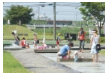
カスケードでの遊び