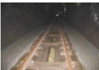
線路との間に挟まる細い溝が水路

フレットをゲットしてから出発しましょう。駅前、左手の広場には、中央本線などで活躍してきた電気機関車「EF64-18」が、今は4118が、今は役目を終えて余生を送っています。その機関車の脇を通りぬけ、小道を登って行くくと「大日影トンネル遊歩道」へ出られます(徒歩3分)。