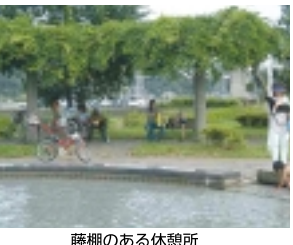
藤棚のある休憩所

年ほど、ドジョウつかみ、ざりかに釣り、水ヨーヨー釣り、Eポット体験乗船等... 坂川親水広場