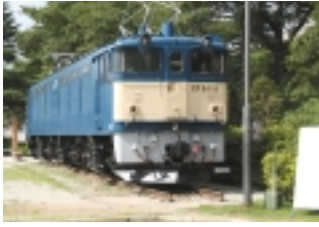
かつて中央本線などで活躍していた「EF64-18」

勝沼は「新宿駅」から約100キロ。ぶどうや桃、そしてワインの町としても有名ですね。JR中央本線の「新大日影トンネル」をぬけると、目的の「勝沼ぶどう郷駅」です。駅でトンネルのパン