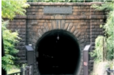
明治36年から平成9年までの間、中央本線の列車を見送り続けた「大日影トンネル」(現「大日影トンネル遊歩道」)

勝沼は「新宿駅」から約100キロ。ぶどうや桃、そしてワインの町としても有名ですね。JR中央本線の「新大日影トンネル」をぬけると、目的の「勝沼ぶどう郷駅」です。駅でトンネルのパン