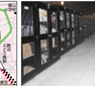
かつて「旧深沢トンネル」として利用されていたこちらは、現在は「勝沼トンネルワインカーヴ」として利用されています。

※詳細はHP「大日影トンネル」等で検索をしてみてください。旧深沢トンネルからは、ウォーキングコース「勝沼フットパス」が設定されていますが、今回はひんやりトンネルを駅まで戻り、「ぶどうの郷」と今が旬のぶどうの郷を紹介いたします。(2ページへつづく)