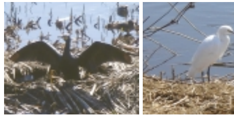
カワウ(左)とコサギ(右)

【鳥がいつぱいだ】「国分川」がにぎやかなのは、なんと10月まで冬アシやガマの枯れ穂が水鳥たちの格好の隠れ場所です。カモが川面を埋め尽くすほど集まっています。逆立ちした丸いお尻を並べて餌取り。愛嬌たっぷりです。