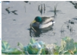
季節になれば埋め尽くすほどのカモ!

【鳥がいつぱいだ】「国分川」がにぎやかなのは、なんと10月まで冬アシやガマの枯れ穂が水鳥たちの格好の隠れ場所です。カモが川面を埋め尽くすほど集まっています。逆立ちした丸いお尻を並べて餌取り。愛嬌たっぷりです。