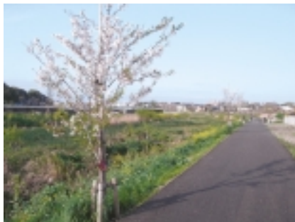
のどかな田園風景が楽しめる遊歩道

「遊歩道もある」 「黎明橋」獅子舞橋間は川辺の道が整備され「国分川遊歩道」ができあがりました。お披露目のあった2月半ば過ぎ、近くの小中学校の生徒が集めて、遊歩道沿いに桜の苗木を記念植樹したそうです。