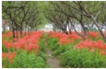
そろそろ見ごろな彼岸花

真っ赤な細い花びらを傘に広げた彼岸花。またの名を曼珠沙華(まんじゆしゃげ)ともいい、秋を代表する季節の花でカメラ愛好家にも好まれる花になっていきます。その彼岸花をはじめ、秋を彩る花が咲く「中川やしおフ