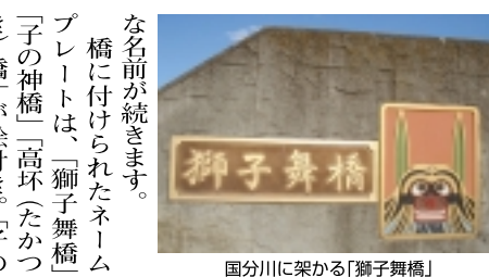
国分川に架かる「獅子舞橋」

【「街路ができた」】今年7月1日、「国分川」沿いに新しい街路が開通しました。正式名称は「松戸都市計画道路3-3-6号三小台主水新田線」と言います。車を走らせてみました。(2ページへつづく)