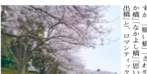
秋山弁天橋付近の桜並木

【「街路ができた」】今年7月1日、「国分川」沿いに新しい街路が開通しました。正式名称は「松戸都市計画道路3-3-6号三小台主水新田線」と言います。車を走らせてみました。(2ページへつづく)