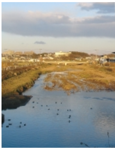
夕暮れ時の国分川