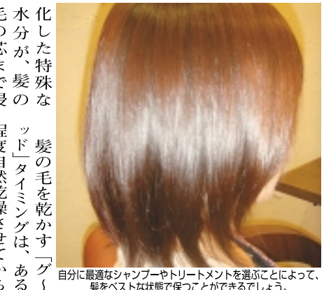
自分に最適なシャンプーやトリートメントを選ぶことによって、髪をベストな状態で保つことができるでしょう。

ご自宅でのトリートメントをオススメします。「トリートメント」とは髪の毛の内側に栄養(水分・油分・タンパク質)を補う働きをし、髪の毛にハリ・ツヤを与え、しなやかにする働きがあります。お風呂から出て顔に化粧水や保湿剤を付けるように、髪の毛も同じくケアしてあげましょう。