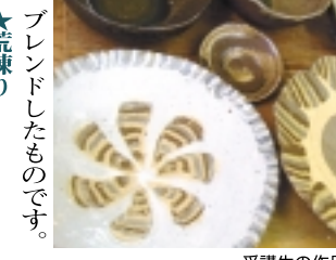
【ステップ3】仕上げにサイン

「ステップ3」仕上げにサイン 厚い乾いた素焼きの皿の縁を削り、指の跡などを修正して完了。焼き上がり