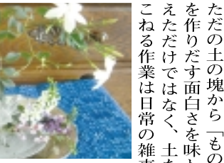
2枚重ねて花を生けてみました

「陶工房山川」陶芸教室のみなさんの作品も同時に焼き上がりしました。経験豊かな方々の作品は素人とは思えないみごとな出来栄。素敵な大型の花器に仕上げたサンドペーパーをかけていた方は、「これまでに作った作品のほとんどは人にあげておかないでください」と、お返しをしてくるようです。(Nono)