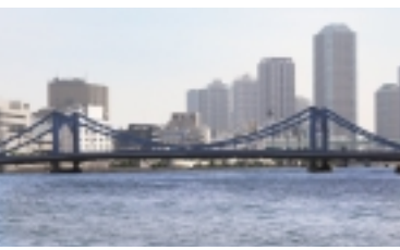
万年橋付近から清洲橋を望む

現在のこの地から富士山は見えませんが、「ケルンの眺め」と称し、次に架かる「清洲橋」が一番美しく見えるビュースポットになっています。ここから先の橋は、次回紹介します。