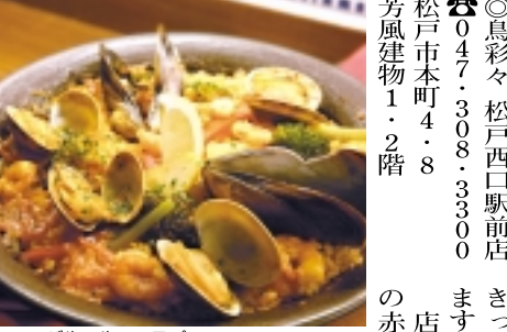
バルマル・エスパニーヤ

「松戸ラドン温泉」お風呂も入れて、食事もお楽しみ。松戸ラドン温泉。「ラドン」とはラジウムから発せられるアルファ波で、自然界に存在する物質の中で最も強力なイオン化作用があります。このラドンを含んだお風呂は体の温まり方が違い、家に帰るまでホカホカ感が続くそうです。他にも天然水を使用した天然岩風呂をはじめ、イベント風呂など様々なお風呂が楽しめます。更に簡単な軽食から宴会料理まで揃っていますのでお腹も体も温まります。