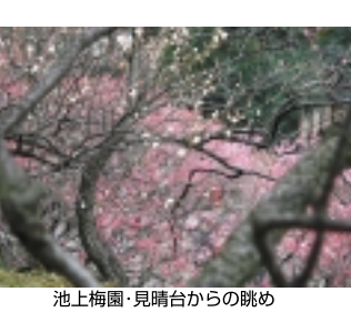
池上梅園・見晴台からの眺め