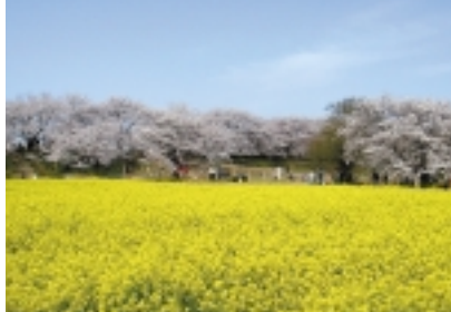
権現堂桜堤 (2008年4月5日撮影)

落。土手の川側(北越谷パブリックコース側)よりも、道路側の斜面の方がさらにひきたてられているのは、堤の周囲にひろがる広大な菜の花畑。黄色いじゅうたんを敷き詰めたような風景は日本の春そのもの。まさに「いちめんのなのはな」の世界です。昔から日本人に親しまれてきた菜の花。3月下旬から4月にかけて、菜の花が盛り頃の頃に降り続く雨を菜種梅雨と言いますが、お花見には恨みの雨も春の植物にとっては恵みの雨なのでしようね。(Nono)