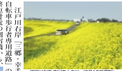
江戸川右岸 吉川市上内川 (3月13日撮影)

この上流も流山市域では菜の花の小群落が点在しますが、利根運河を越えて野田に入ると、菜の花は少なくなりますが、しかしあきらめずに上花輪まで行くと、対岸のゴルフ場の土手は黄色く染まっています。「39km」過ぎの野田橋を渡ると吉川市の江戸川右岸には、「38km」付近を中心に2km以上にわたって菜の花の大群