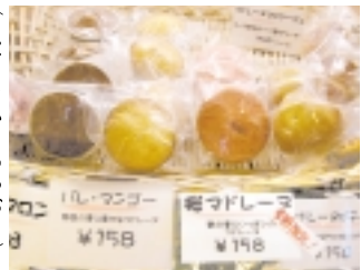
スイーツテイズの「さくらのマドレーヌ」