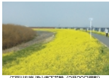
江戸川左岸 流山市下花輪 (3月20日撮影)

に見える下花輪の土手。29・75kmの距離標が立つこの辺りは、約1kmにわたって菜の花が土手の両側に咲き乱れます。川がカーブしているため絶好のビューポイント!