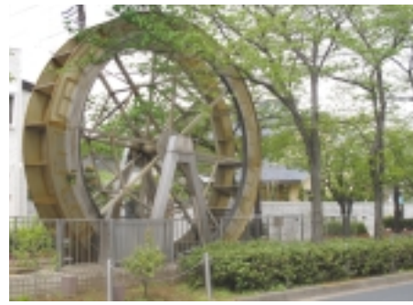
「葛西用水親水水路」出発地点の水車