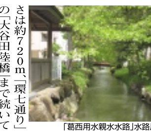
「葛西用水親水水路」水路風景

JR常磐線「亀有駅」北口を出ると「やあ、いらっしやい!」太い肩と大きな目玉「マンガ」こちら葛飾区亀有公園前派出所「お馴染みの「両さん」がお出迎え!その右前方に見えるのがモデルとなった交番でし