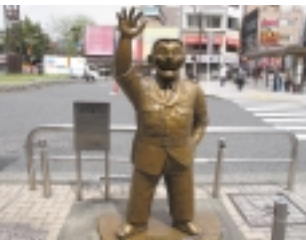
こち亀の「両さん」像

駅前ロータリーの左前方の路地を入り、直ぐに右折左折とクランク状に進むと桜並木の車道に出ます。車道を右方向へ進んでいくと最初の目的地「葛西用水親水水路」へ到着します。(亀にも、両さん像有り)