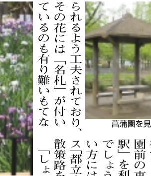
菖蒲園を見渡すあづま屋景観