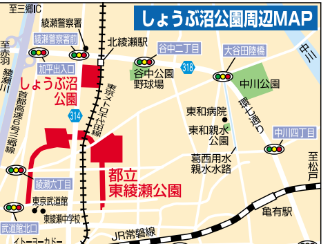
しょうぶ沼公園周辺MAP