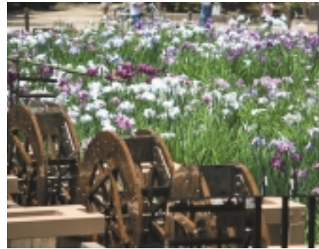
「しょうぶ沼公園」の三連水車