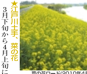
菜の花ロード(2010年4月撮影)

★江戸川土手、菜の花 3月下旬から4月上旬にかけて、江戸川土手一帯は数百メートルにわたる、菜の花で埋め尽くされた景観となります。