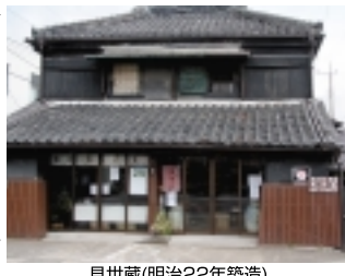
見世蔵(明治22年築造)