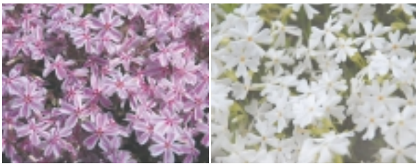
清楚な「多摩の流れ(写真左)」と可憐な「モンブラン(写真右)」

会場内をゆくりと楽し... ひと周するのにおよそ90分ほどですが、私は写真撮影や飲食に夢中になり、3時間位いました。帰る時には、帰る人と新たに会場に来る人で、もう人々々々、いつも満員で賑わうテーマパークを思い出させるほどです。会場は整備されていると