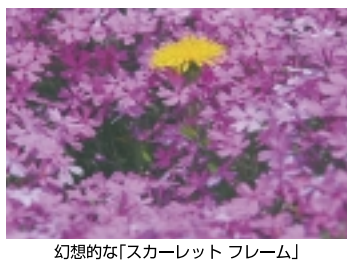
幻想的な「スカーレット フレーム」

「富士芝桜まつり」では時の経過を忘れ、心が癒されます。日ごろ何かと気疲れの方には是非一度お訪ねされるようお奨めします。(お富さん) ※今回の内容は昨年(2010年)に「富士芝桜まつり」会場取材したものです(写真も含む)。また、開花状況などにより日程が変更する場合がありますので、お出かけの際には左記までお問い合わせください。 ◎富士芝桜まつり事務局 0555・89・3031 ホームページ http://www.shizakura.jp/