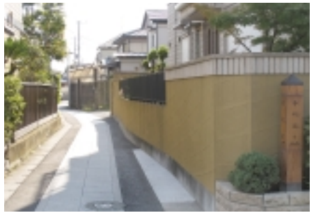
徳川家康が歩いた権現道(道標)出合

★権現道 徳川家康が東金方面へ鷹狩りに行った時には、行徳まで船で来られ、この「権現道」を通ったと伝えられています。現在その道の一部は残っていますが、その面影は無く、お寺が軒を並べた通りとなっています。「権現道」には白い敷石が敷かれ、敷石に沿って左方向へ行く「寺町通り」へと出られます。その出口には「権現道」を印す道標があり、「寺町通り」がまっすぐ伸びていて「妙典駅前」と通じています。