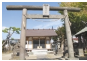
五カ町大祭礼で有名な神明(豊受)神社

その「徳願寺」の手前の交差点の通りが「内匠堀」(たくみぼり)のあった所です。かつては鎌ヶ谷方面から水を引いて農作物を耕し、人々に潤いと恵みを与えてくれました。現在はその役割は終え、雨水などの排水用暗渠溝(あんきょこう)になっています。(詳細は徳願寺入口の解説板参照。)