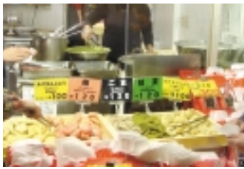
名物あげまんじゅう