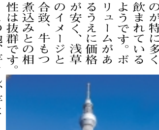
天空に輝く東京スカイツリー

【庄ホッピー】 「ホッピー」の名称は登録商標で、一般的にはビールテイストの飲料をいいます。が、焼酎をこれに割ったものが特に多く飲まれているようです。ホッピーは価格が安く、浅草のイメージと合致、牛もつ煮込みとの相性は抜群です。