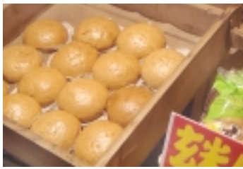
アツアツの玄米パン

【玄米パン】 昔、浅草の縁目を訪ねた際に売りのおばさんが「玄米パンのほや、ほや」と言いながら売っていました。今回はそんな売り声が、確認したら「知らないね」と言われました。年月が経過、きつと売れる人もお客も変わっているのですね。