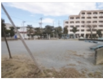
江戸情緒、下町の雰囲気

【公園めぐり】 今紹介する「太郎児童公園」のある場所は江戸川の側、江戸川といえは言わずと知れた松戸の景勝地。代表的な市民の憩い場所です。川側の市街地は建物が密集し、緑豊かな場所は近代的な発展も江戸川の緑豊かな姿は昔のまま。しかも松戸駅西口から直線距離にして1km程度の範囲にも関わらず公園の周辺は閑静で、園内のベンチに腰を下せばとても穏やかな気持ちに包まれます。