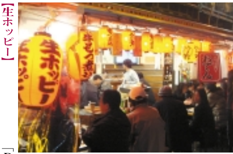
絶妙! ホッピーと牛もつ煮込み

【Beetawar】は、地上45メートルの高さから浅草を一望できます。浅草の歴史と共に歩んできたテーマパークです。