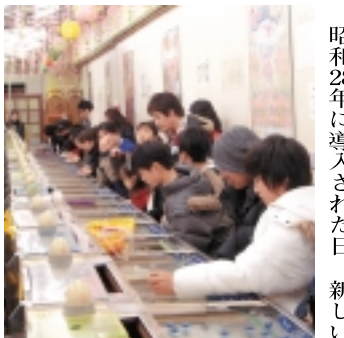
昔懐かしスマートボール

(1ページからのつづき) 歓楽街である浅草は老舗の名店や縁日の屋台でもグルメをうならせてくれます。