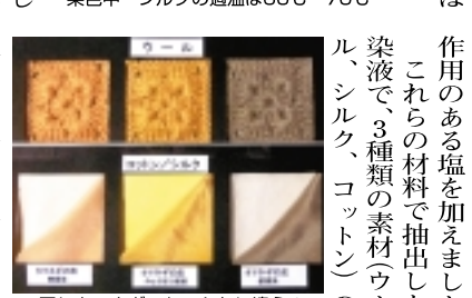
染色中 シルクの適温は60℃〜70℃

「キッチンで手軽に」ハーブ染めを体験してからは、ハーブ以外のさまざまなものも「きれいな色に染めよう」と試してみたり。使ったのはタマネギの皮、サザンカの花びら、シソジュースなど。手近なものばかり。プレリーパーティーや紅茶には色止め作用のある塩を加えました。これらの材料で抽出した染液で、3種類の素材(ウール、シルク、コットン)の