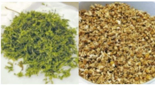
タンジー(左)とカモミール(右)

【ハーブ染め】 「松戸ハーブボランティア」の勉強会に参加し、基本のハーブ染めを体験しました。この日使ったハーブは、タンジー、ラベンダー、アップルミント、レモンダラス、マテ、マダー(アカネ)の6種。さまざまなハーブの香りが立ちのぼる中、やさしい色合いのストールが次々と染め上がりました。