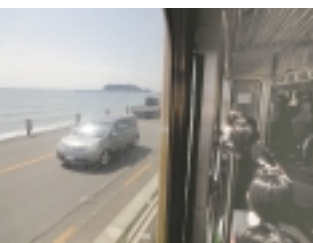
江ノ電の素晴らしい車窓

【稲村ヶ崎にて】 江ノ電を鎌倉方面に戻り「稲村ヶ崎」で下車しました。「稲村ヶ崎」は太平記の新田義貞伝説で有名な景勝地。公園