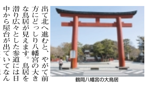
鶴岡八幡宮の大鳥居