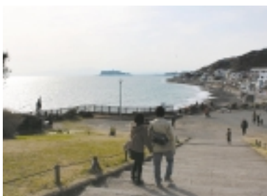
稲村ヶ崎は景色も素敵な憩いの場

【稲村ヶ崎にて】 江ノ電を鎌倉方面に戻り「稲村ヶ崎」で下車しました。「稲村ヶ崎」は太平記の新田義貞伝説で有名な景勝地。公園