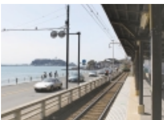
まさに絶好のロケーション、鎌倉高校前駅

【鎌倉高校前駅】 鎌倉は写真が撮れば何処でもベストショットになるくらい素敵な景観ばかりですが、この駅は特に作品になる場所。ホームに立つだけで誰もがドラマの出演者に見えます。