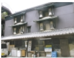
島村家土蔵 (お助け蔵)