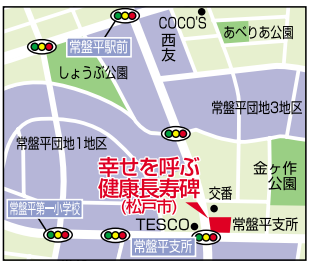
「幸せを呼ぶ健康長寿」碑

トが点在し、ちよ つとした野外美術 館です。また、建 設当時の日本にあ つてモダンな極み であったに違いな い10棟のスターハ ウス(星型住宅) が往時のままの姿 で現存しています。常盤平 団地は松戸市の中でも屈指 のアーティスティックな空 間と言えるでしょう。 団地自治会では発展や和 健康といったことを願って、 節目節目にモニユメントを 制作してきました。「幸せ を呼ぶ健康長寿」碑もその ひとつです。常盤平駅前 立つ時計塔は20周年の記念 立時計塔の三本柱は地域・松 戸市・日本住宅公団II現在 のUR都市機構を象徴して います。常盤平支所前 の親子の像「ふれあい」 と「碑」は30周年の記 念です。