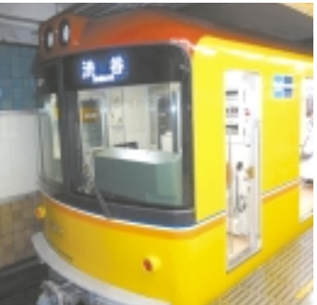
レトロと最新鋭が調和した銀座線新型1000系!

記者はまだ数少ない1000系に乗ろうと先日出掛けるところ、ひと駅で待ち構えていれば意外と時間を掛けた。ちなみに日本初の地下鉄1000系車両は地下鉄東西線「葛西駅」の地下鉄博物館にて展示されています。是非1000系と見比べてください。