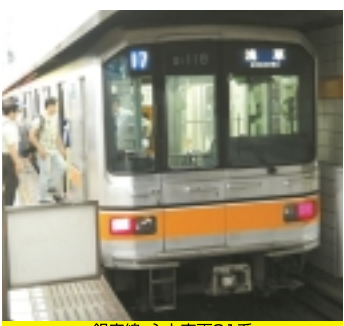
銀座線、主力車両01系

（1ページからのつづき） 【新橋駅G108】鉄道発祥の地と新橋駅のホーム 鉄道発祥の地「新橋停車場」は、汐留貨物駅の地にありましたがその貨物駅も再開発されて、現在では高層ビルが立ち並び立派なオフィス街に変貌しました。しかし、明治期の遺構は「旧新橋停車場跡」として駅舎、ホーム、レールと忠実に再現され当時を偲ぶことができます。