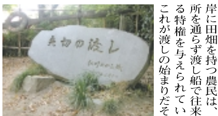
演歌「矢切の渡し」記念碑

下にあります。駅を出た表参道交差点には左右2基の大きな石燈籠がありその名残を見せますが、現在は多くの車が通り交う大通りです。通りの両側には有名ブランド店が並び、ケヤキの街路樹に沿って原宿方面に歩いて行くと「青山同潤会アパート」の跡地には若者に人気の商業施設「表参道ヒルズ」があります。