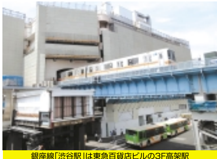
銀座線「渋谷駅」は東急百貨店の3F高架駅

そして、地下鉄「新橋駅」には昔有名な「幻のホーム」が存在します。渋谷方面から来る先頭車窓にてチラッと様子は伺えますが、実は銀座線は二社の路線が繋がった線、合併する以前は「新橋駅」には互いの終着駅が別々に存在しました。やがて合併後、その一駅は廃駅になりましたが現在でも留置線として残り「幻のホーム」と呼ばれてきました。