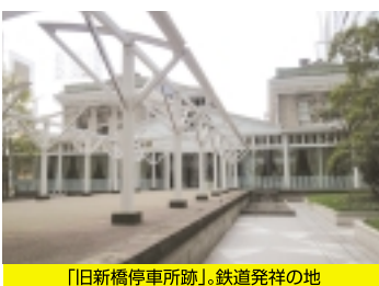
「旧新橋停車場跡」。鉄道発祥の地

そして、地下鉄「新橋駅」には昔有名な「幻のホーム」が存在します。渋谷方面から来る先頭車窓にてチラッと様子は伺えますが、実は銀座線は二社の路線が繋がった線、合併する以前は「新橋駅」には互いの終着駅が別々に存在しました。やがて合併後、その一駅は廃駅になりましたが現在でも留置線として残り「幻のホーム」と呼ばれてきました。