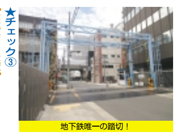
地下鉄唯一の踏切!

実は4番口は開業当時のほぼそのままの姿であり、浅草寺を考慮し、浅草の土地柄に馴染んでいる仏閣デザインとの理由で「関東の駅百選」に選定されています。また、浅草・上野間は日本初の地下鉄路線で、「開削方法」で造られたトンネル構造は相当