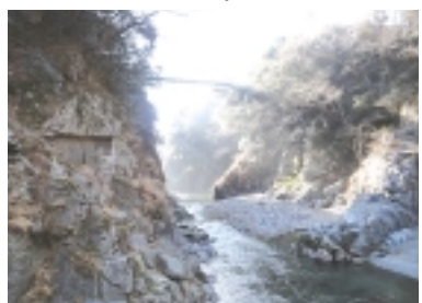
鳩ノ巣渓谷の絶景

ノ巣にて多摩川の水に触れましたが、実に透き通って冷たかったです！清流は最高です！！