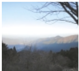
晴れた日には都心一帯が見渡せます

白丸から鳩ノ巣渓谷に通ずる多摩川渓流沿いの遊歩道を歩けると思っていたのですが、なんと現在通行禁止だと知ったのが「白丸駅」のこと。急遽その間、国道を歩きましたが、それでも山間でのウォーキングは気持ちいいものでした。鳩