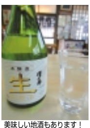
美味しい地酒もあります！

（1ページからのつづき）昔は石灰石を運ぶ貨物列車で賑わったという駅構内は、今やその面影は全く寂しい感じだ。しかし、駅舎は東京都のJR線において一番標高の高い場所。奥多摩観光の玄関口に恥じぬ立派な山小屋風の装いで、ここから路線バスにて日原鍾乳洞や奥多摩湖へのアクセスが可能だ。到着した時刻が昼時とあり、清流の近くには「蕎麦を食べよう」と迷わず駅近くの食堂に入りました。やはり高地の蕎麦は美味しいです！また沿線の地酒「澤乃井」を飲みましたがこれも美味でした。