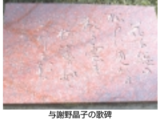
与謝野晶子の歌碑

次いで「戸定歴史館」の方へ曲がると、ふたつ目の歌碑と「ひなげしの小路」のプレートが現れます。道なりに公園奥へと進みましょう。松戸で詠まれたこれらの歌には「松戸」「梨