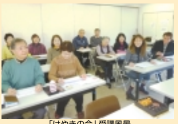
「げやきの会」受講風景

川柳は俳句と共に世界一短い17音の定型詩です。俳諧の前句附けから発生し、江戸時代中期にひとつの文芸として確立。江戸中期から幕末にかけて刊行