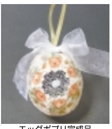
エッグポドリ完成品

だけ。針も糸も要らないエッグポドリならお子さんと一緒に楽しめます。材料および詳しい作り方はWebUKIUKI2010年12月号の特集をご参照ください。