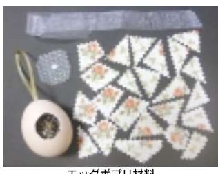
エッグポドリ材料

直径2cmほどの穴を開け、中身を出した卵の殻にラベンダーを詰めて細かく切った薄手の布を貼る。