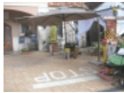
写真：「デザート」に「デザート」をプラスしたものを。メインはパスタ、魚、肉料理から選んで、パン食も満点です。テラス席では月々金曜の17時から19時まで、ビールやワインなどが300円で飲めるハッピーアワーを開催中。ビアガーデンも人気です。

株式会社ユースメディア 電話04-7176-2111・FAX04-7176-2100