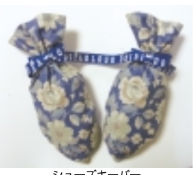
シューズキーパー

作ってしまえば、靴に入れておくといやなおいが取れ靴の型崩れも防げるので、これからの季節はぜひに重宝します。