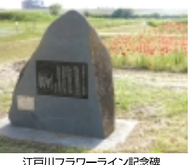
江戸川フラワーライン記念碑

り組む。(省略) 同17年に十周年を記念して碑を建てた。(略)と、刻してあります。当初は春のシゲ、秋のコスモスです。ターゲットは、今では花を愛する方々の努力で、ポピーやヒマワリ、等品種も増え、四季を通じて花が咲き「市民の憩いの場」となっています。