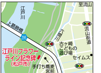
江戸川フラワーライン記念碑 (松戸市)

堤防には自転車・歩行者専用道が整備され、そこを利用する人たちもしばしば足を休める「癒しの場」にもなっています。日中の暑さがうんざりする夏は、近くを流れる「ぶれあい松戸川」の川辺で涼むもよし。また夕日に涼風が心