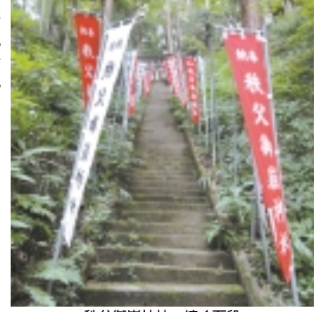
秩父御嶽神社へ続く石段。ぜひ石段制覇にチャレンジしてみてください！

「吾野駅」に降り西武秩父行き電車に乗ります。長い正丸トンネルを抜けて、「芦ヶ久保駅」先のトンネルを抜けると秩父の盆地に出ます。進行方向左手には秩父名物「秩父山」も見えます。「秩父駅」