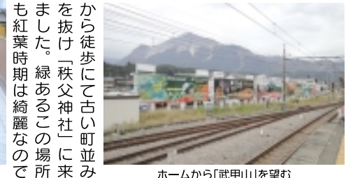
ホームから「武甲山」を望む