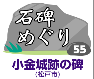
石碑めぐり 55 小金城跡の碑 (松戸市)

1537年の築城から53年後に開城し、その後廃城となった小金城は地元の歴史公園となり、大谷口歴史公園と改名されました。その規模は南北600m、東西800mに及び、東高野地方最大の中世城郭でした。現在では城の面影は残っていませんが、城跡の一部は発見されています。