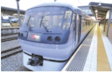
西武特急「レッドアロー」ちちぶ号