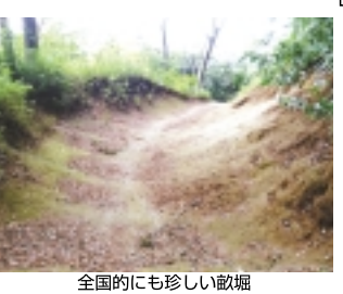
全国的にも珍しい畝垣

もさらに拡大しましたが、1590年の豊臣秀吉の小田原攻めによって北条氏は滅亡、高城氏の支配も終わります。