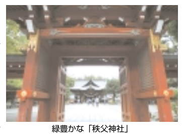
緑豊かな「秩父神社」

「吾野駅」に降り西武秩父行き電車に乗ります。長い正丸トンネルを抜けて、「芦ヶ久保駅」先のトンネルを抜けると秩父の盆地に出ます。進行方向左手には秩父名物「秩父山」も見えます。「秩父駅」