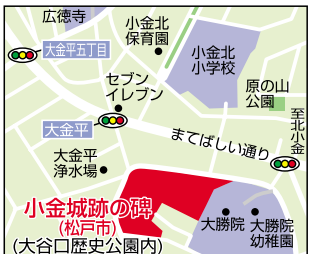
小金城跡の碑 (松戸市) (大谷口歴史公園内)